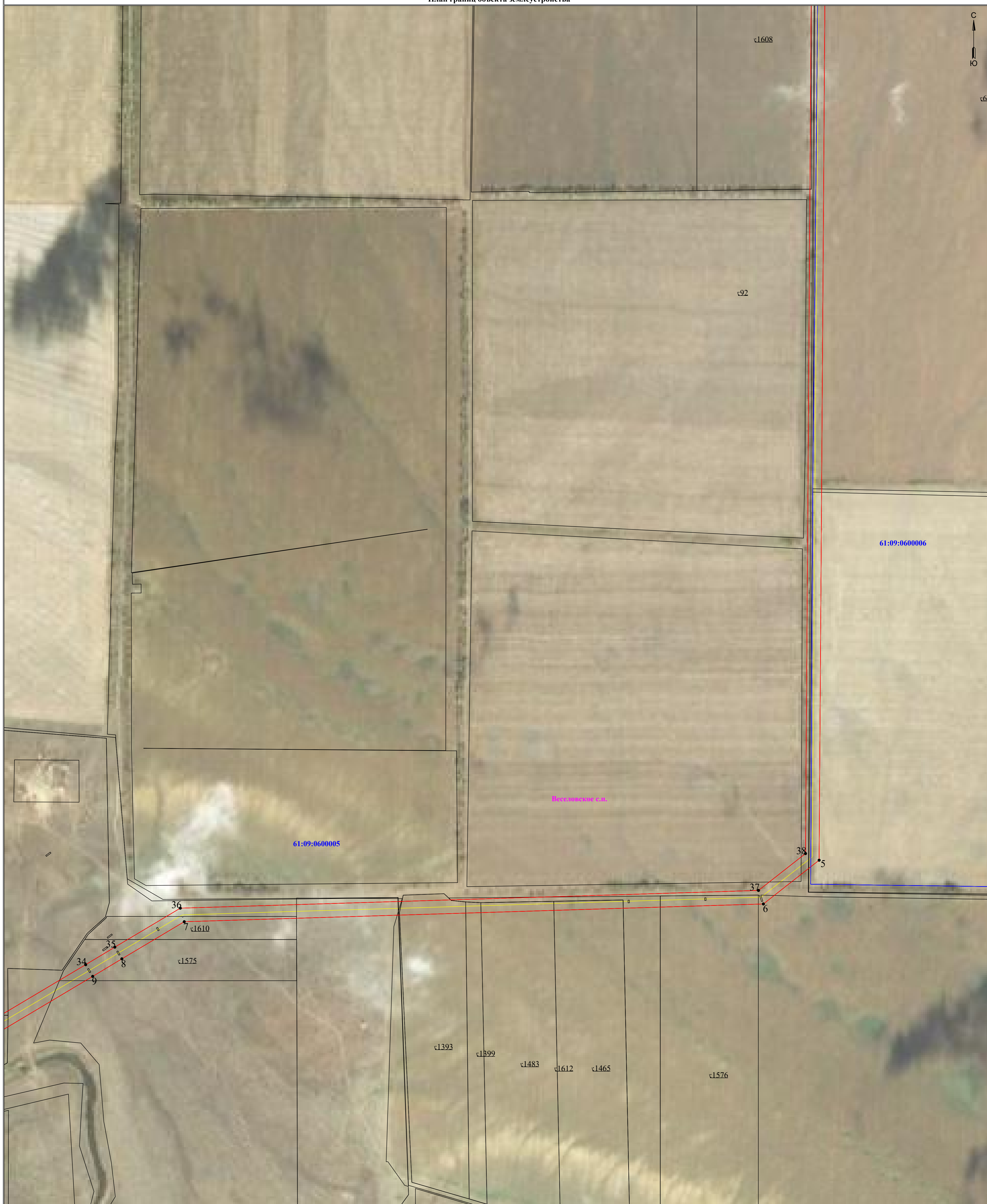
Схема расположения границ публичного сервитута для размещения объекта В.Л 110 кВ "Дружба -Дубовская" к ПС 110/35/10 кВ "Дубовская" (наименование объекта землеустройства) План границ объекта землеустройства