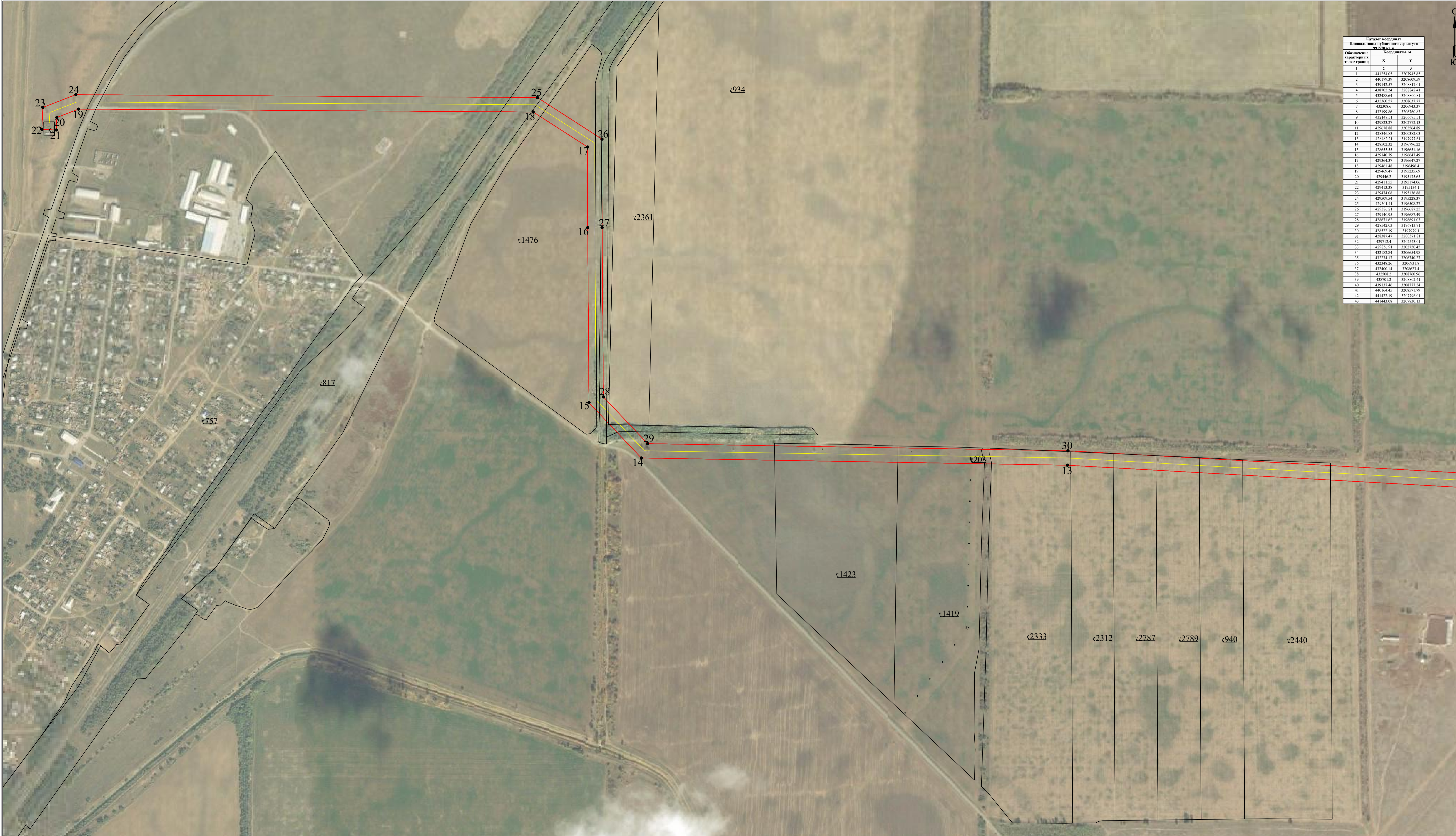
Схема расположения границ публичного сервитута для размещения объекта ВЛ 110 кВ "Дружба - Дубовская" к ПС 110/35/10 кВ "Дубовская" (наименование объекта землеустройства) План границ объекта землеустройства