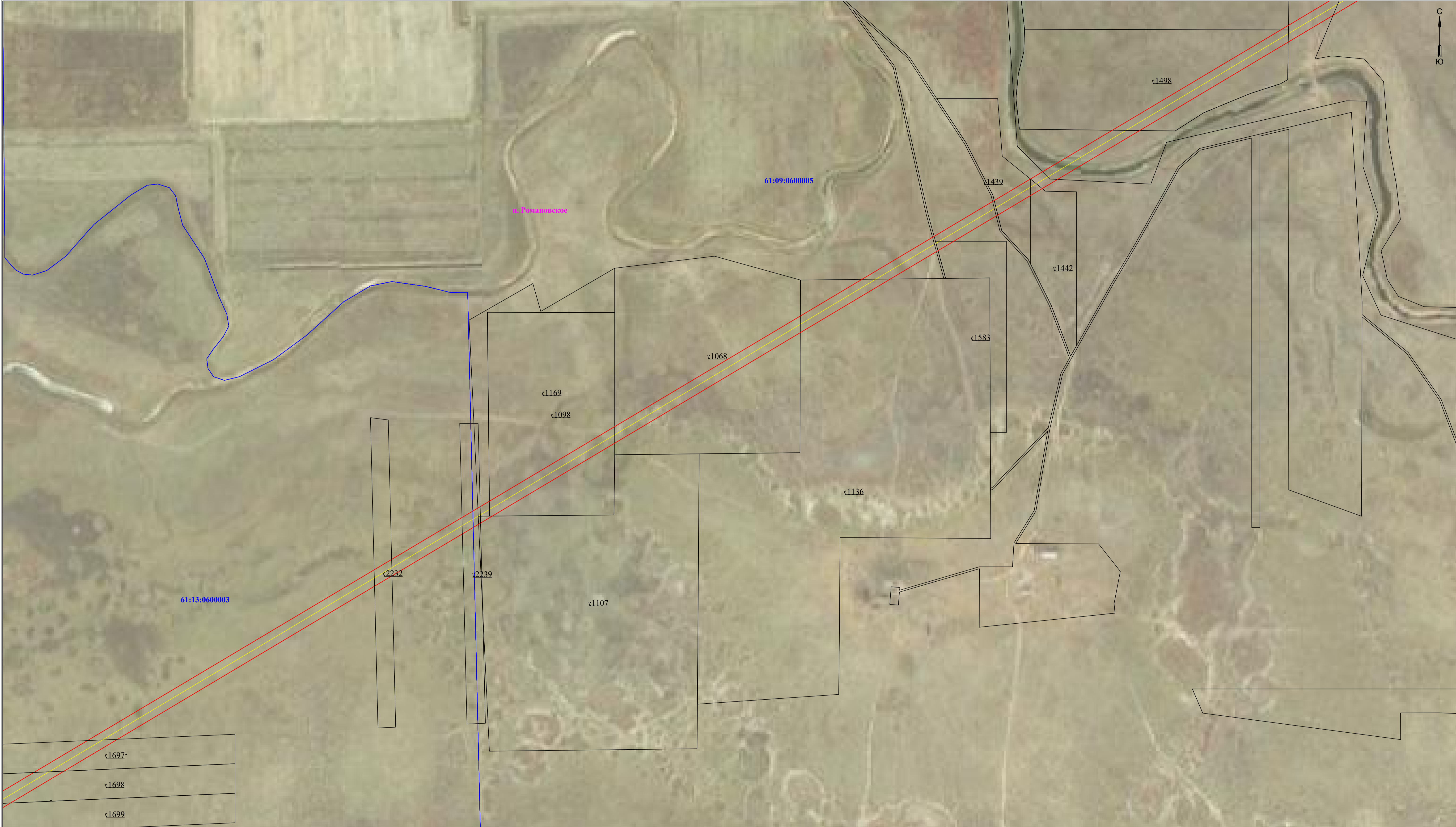
Схема расположения границ публичного сервитута для размещения объекта ВЛ 110 кВ "Дружба -Дубовская" к ПС 110/35/10 кВ "Дубовская" (наименование объекта землеустройства) План границ объекта землеустройства