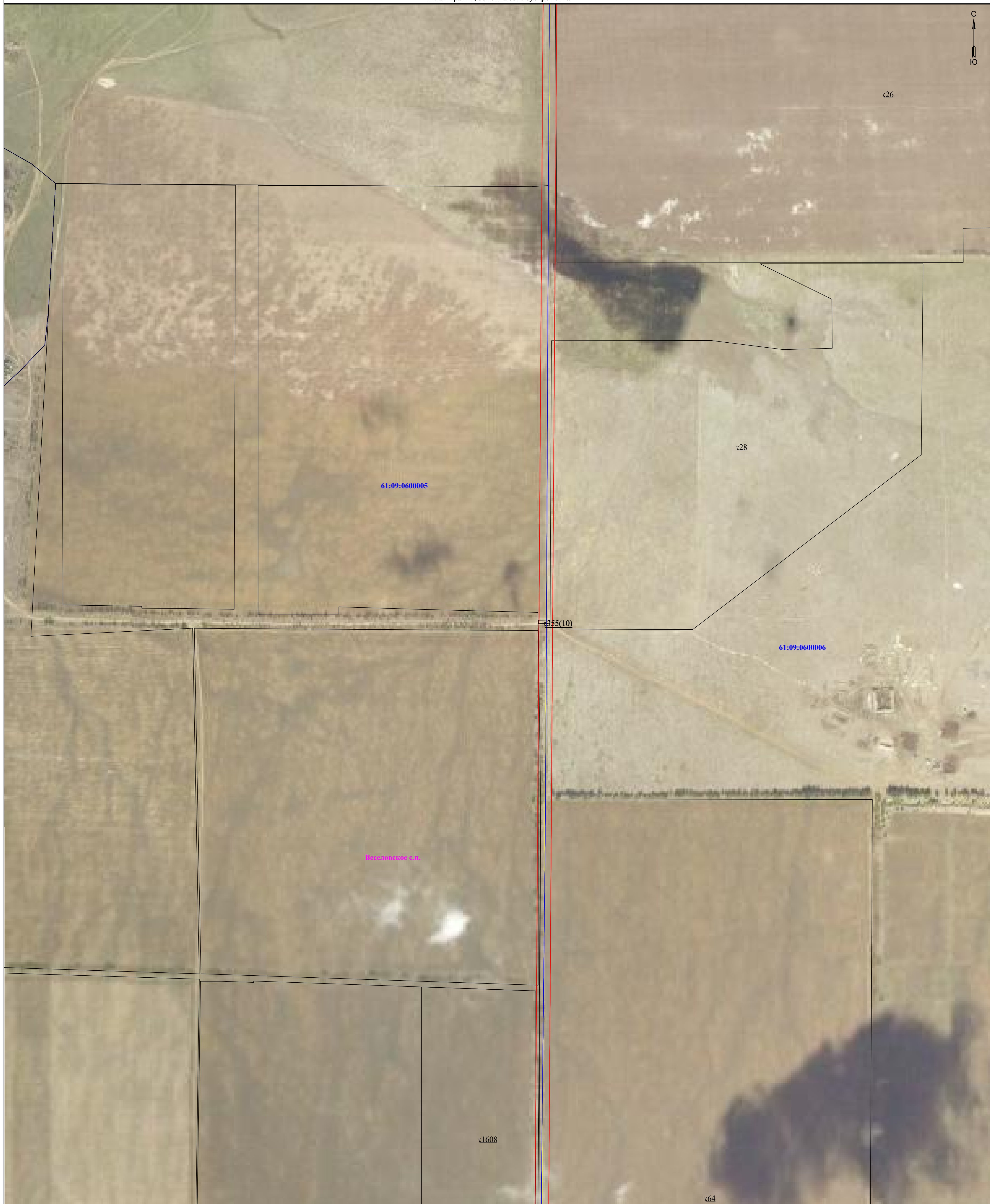
Схема расположения границ публичного сервитута для размещения объекта ВЛ 110 кВ "Дружба -Дубовская" к ПС 110/35/10 кВ "Дубовская" (наименование объекта землеустройства) План границ объекта землеустройства