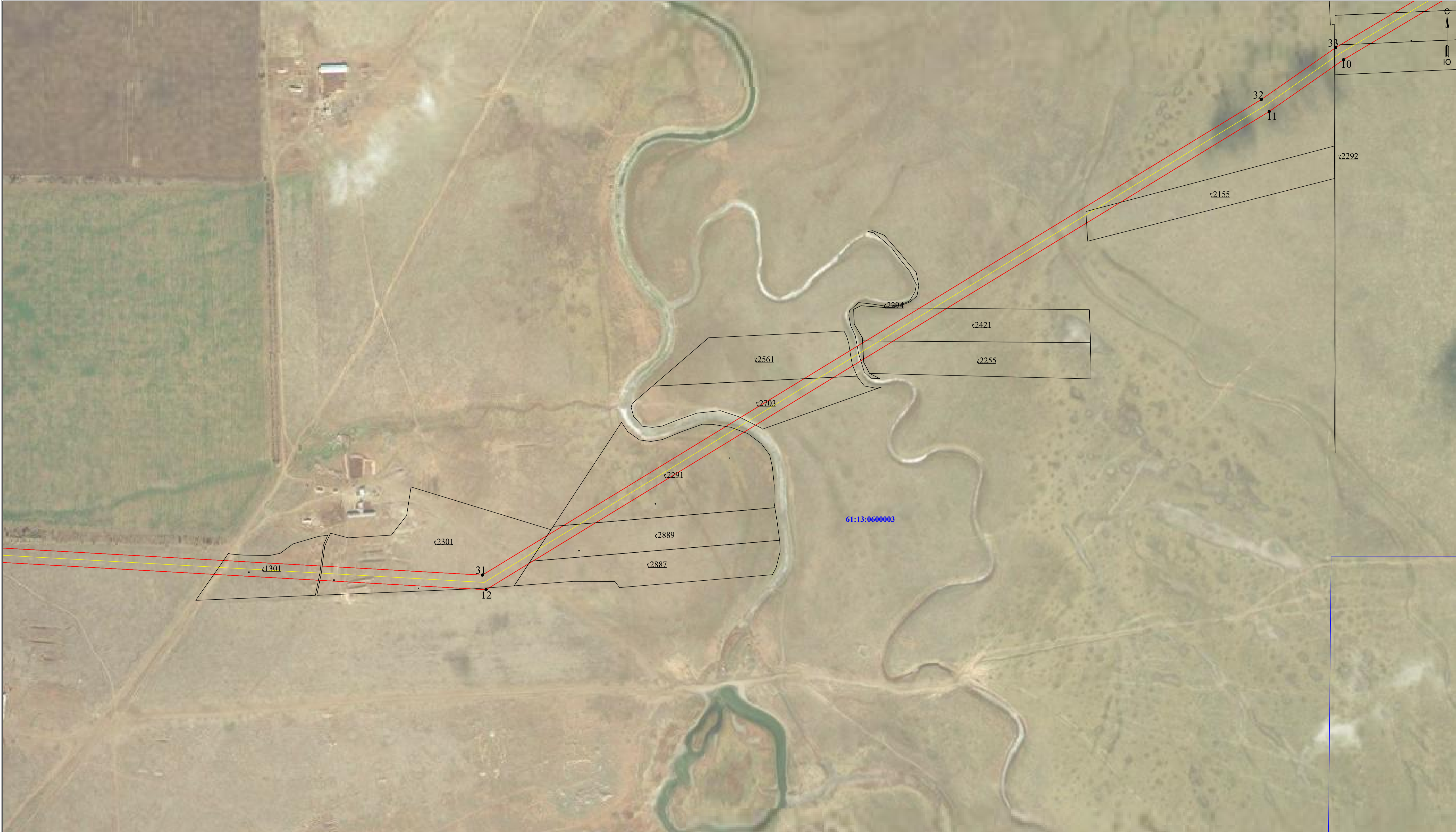
Схема расположения границ публичного сервитута для размещения объекта ВЛ 110 кВ "Дружба - Дубовская" к ПС 110/35/10 кВ "Дубовская" (наименование объекта землеустройства) План границ объекта землеустройства